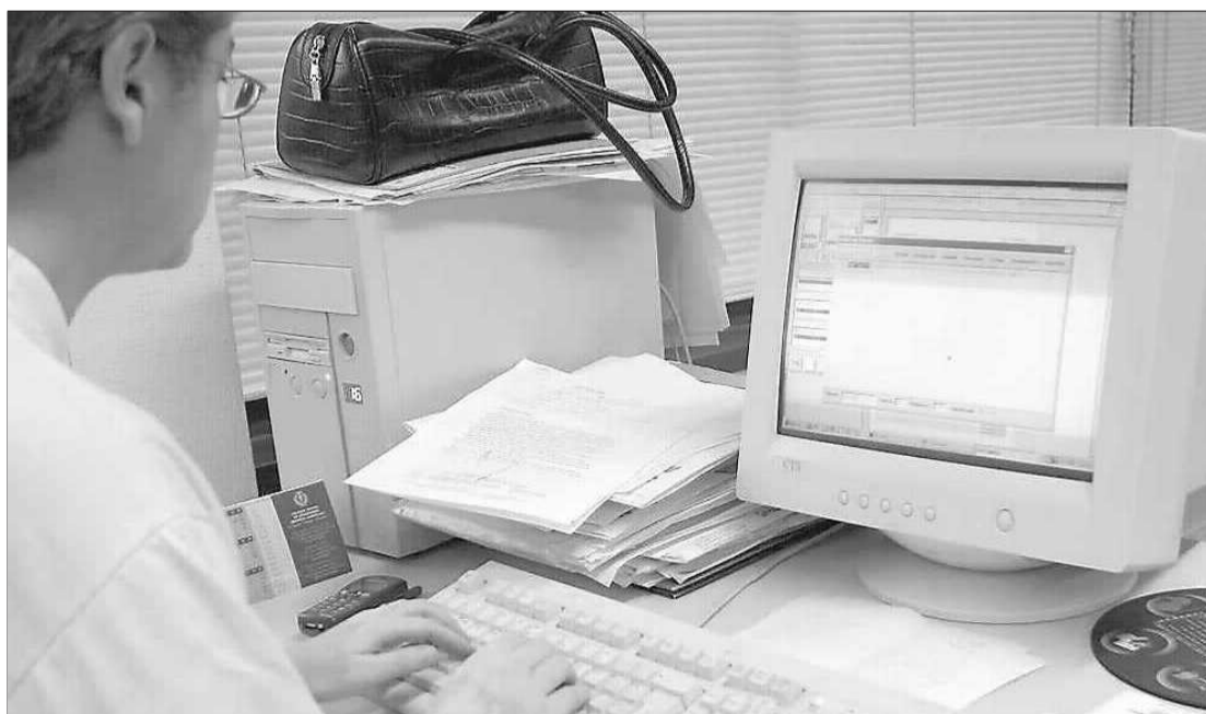
Los foros de internet acogen diferentes opiniones, como la que expresa esta chica.

También quien, al hilo de la expectación despertada por el primer debate Zapatero-Rajoy y sobre todo las mil y una especulaciones sobre quién ganó o perdió ese día señala: "Señores anoche ganó la banca. La banca nunca pierde. No va más". Sin dejar el debate, ahí va otra pildorita,