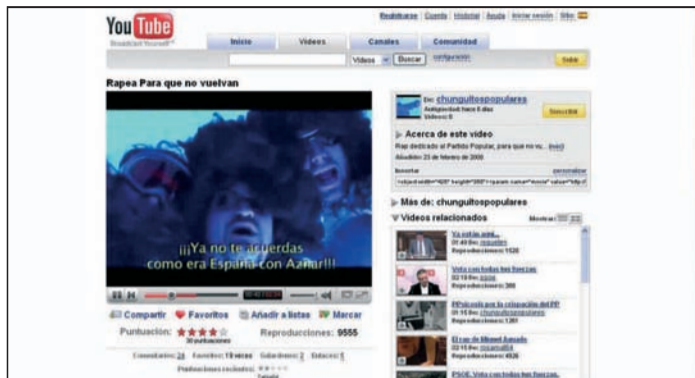
El video del rap "Para que no vuelvan".

La respuesta no se hizo esperar. "Este es el hombre que España ya conoce/porque es