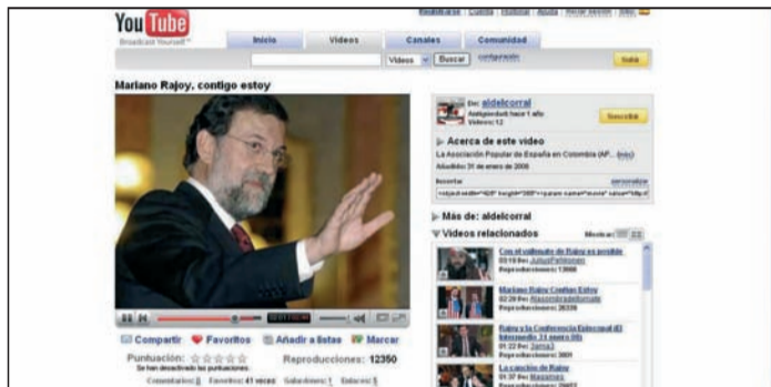
El vídeo del vallenato en apoyo a Rajoy.

honesto y sabe trabajar". Así comienza el vallenato (canción popular colombiana) que compuso el cantautor colombiano Gerjes Ubaque para la Asociación Popular de España en Colombia y que no tardó en cruzar el charco para ser protagonista de todos los mítines del Partido Popular.