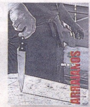
Arraianos VIII (Vivir na raia) Director, Aser Álvarez, coord., Suso Díaz e Aser Álvarez, Asociación Arraianos, Alvarellas Editora, 2010, 291 páxs. 10 €

bedoría e emocións que nos leva a lombos dos ríos e os montes, a reserva do Gerés-Xurés, a literatura e a fronteira, as relacións entre Galicia e Portugal, os camiños portugueses, os arraianos de todo tipo e condición, os festivais da raia, ou o camiño xacobeo Miño Ribeiro. A revista complétase con varias páxinas dedicadas á creación e á crítica e está ilustrado polo fotógrafo estremeño Antonio Covarsi. Excelente número, excelente publicación.