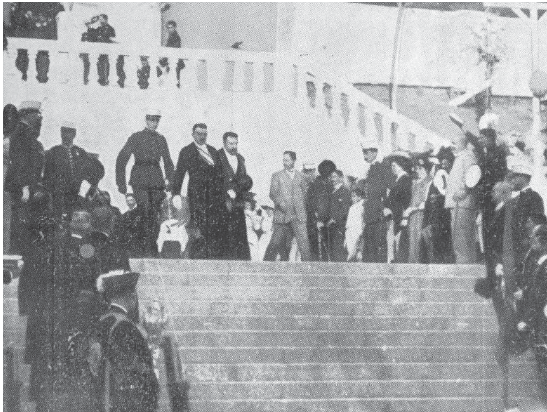
O rei Alfonso XIII fai a súa entrada no recinto da Expo, baixando pola coñecida escalinata