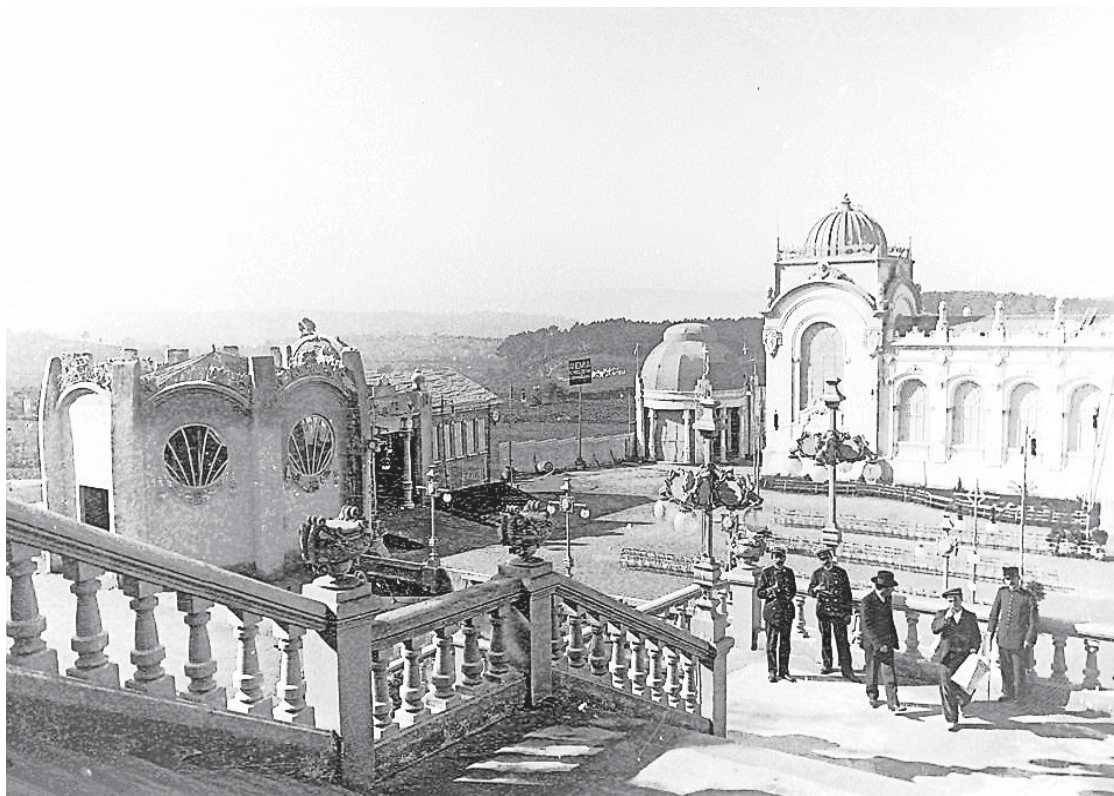
Vista do Pavillón Central da 'Exposición Regional Gallega', baixando dende a escalinata

A unión fai a forza. Esa parece ser a máxima que guiou o desenvolvemento da Exposición compostelana de 2009. As once construcións foron extraordinarias, malia que, a causa do mal tempo que se cebou coa instalación, o Pavellón do Ministerio de Fomento veuse abaixo tan só tres días despois da apertura. A magna obra estivo en mans de arquitectos de primeira categoría, como Antonio Palacios, Antonio Flórez, autor do Pavillón central, ou o seu axudante, Gómez Román. Alvarellos, no libro recentemente publicado sobre o evento,