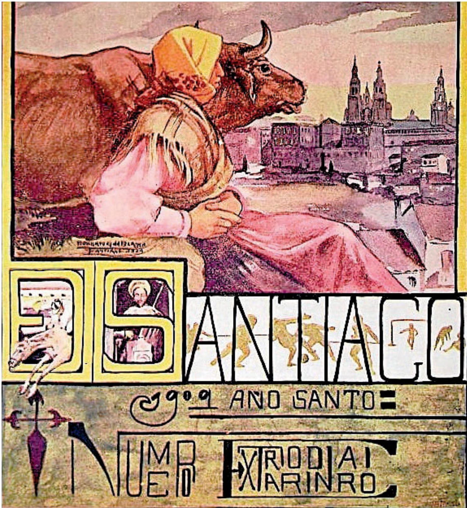
Portada do número extra de 'El Eco de Santiago' publicado o 25 de xullo de 1909, arredor da 'Exposición Regional' e o Ano Santo.

Fernando Iwasaki habla de 'España, aparta de mí estos premios' p6y7