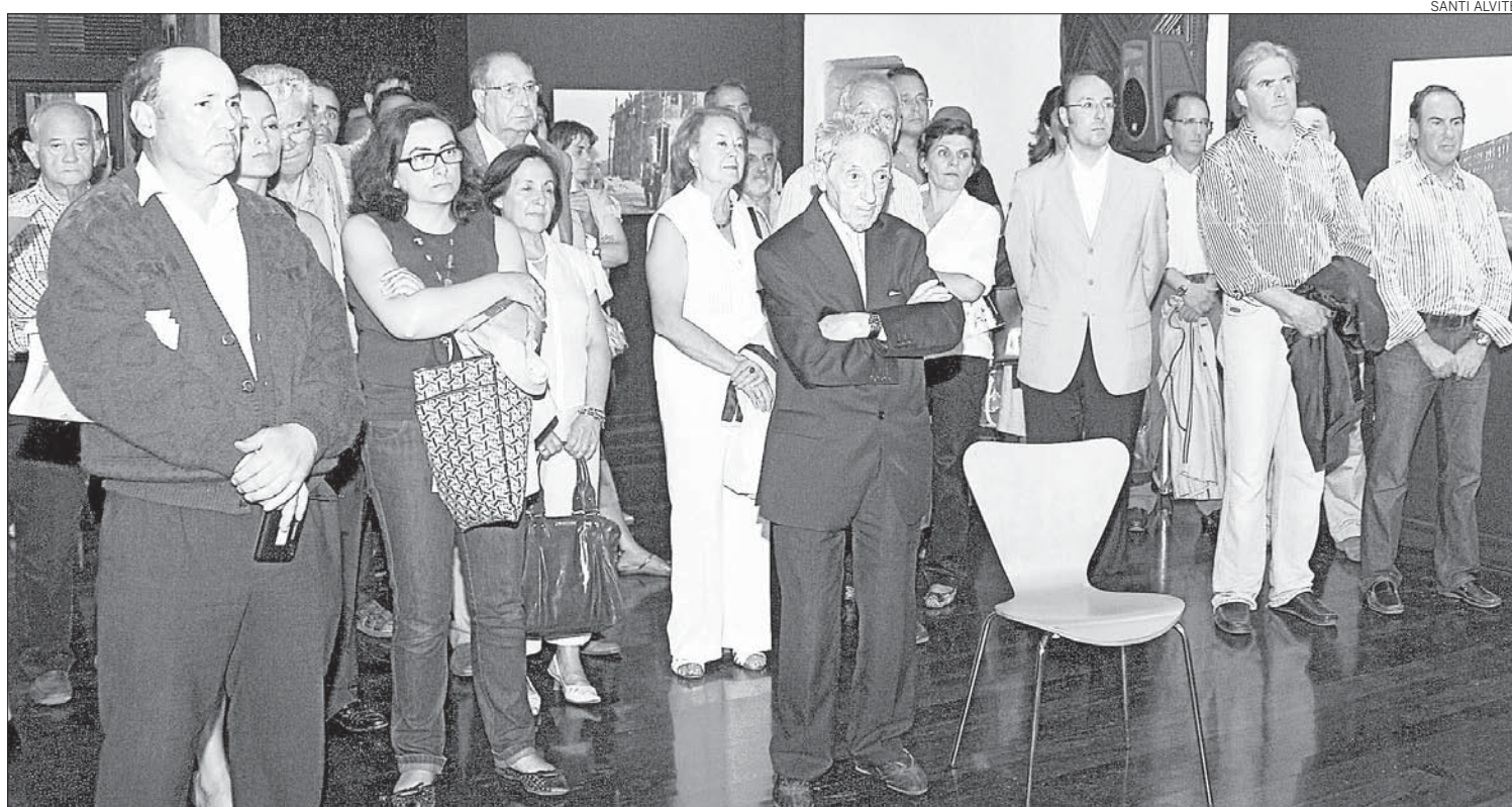
Asistentes a la inauguración de la muestra 'Santiago, 1909. Centenario da Exposición Rexional Galega' en el Colegio de Fonseca