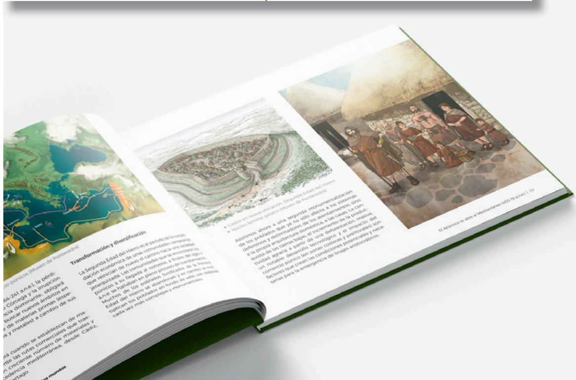
«Campesinos y guerreros» Edad del bronce final (800-400 a.n.e.) | 19

de Póncica (Museo de Pontevedra) de 240 años), la pérdida de Corcoba y la irrupción de nuevos ámbitos en busca de nuevas primas (temples y metales) a cambio de sus ría cuando se establecen de manera creciente número de mercados y dependencia mediterránea, desde Castiz.