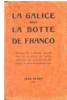
Edición francesa de 1938